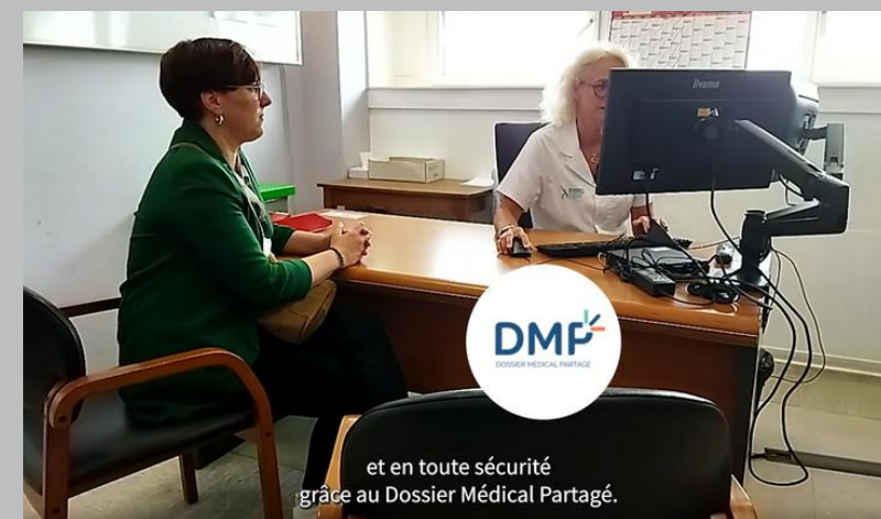
Épisode 2 : Dossier Médical Partagé