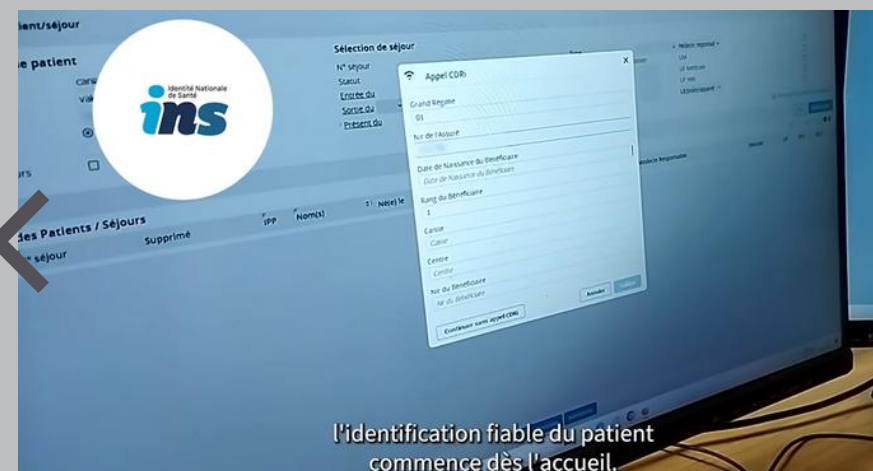
Épisode 1 : Identité Nationale de Santé