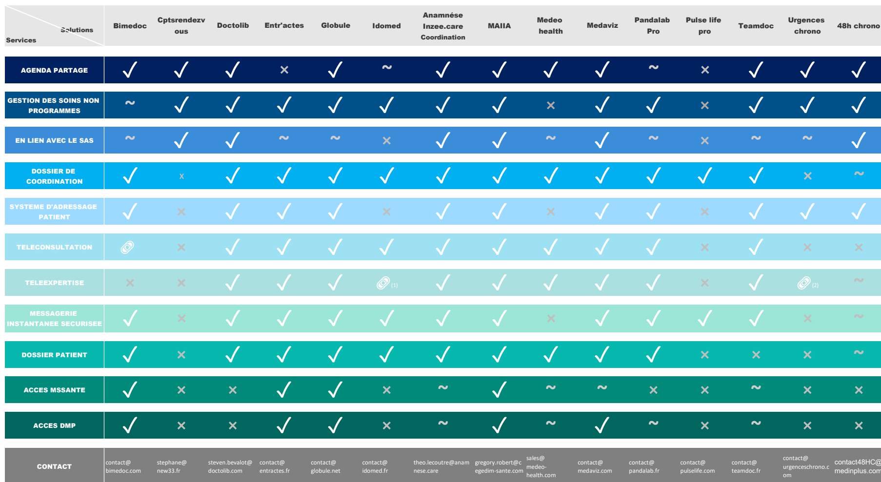
TABLEAU 2 : PANORAMA DE SOLUTIONS POUR LA COORDINATION MEDICALE DES CPTS